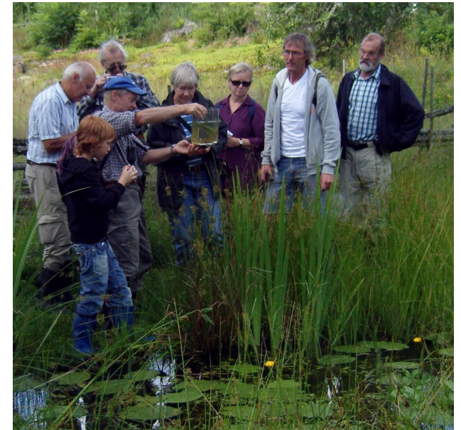
Exkursion till Ölvedal där vi studerar vattenlevande djur.